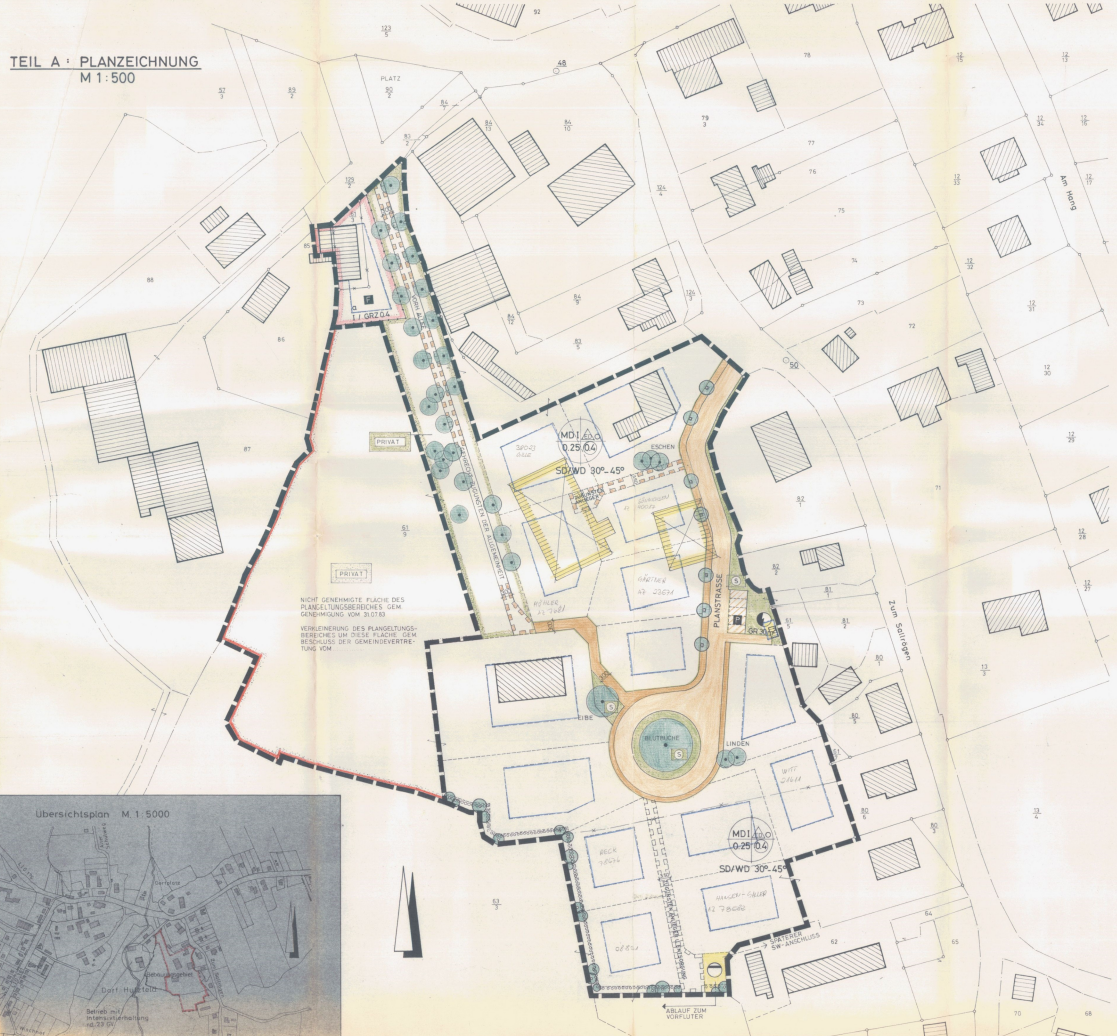
TEIL A : PLANZEICHNUNG M 1:500