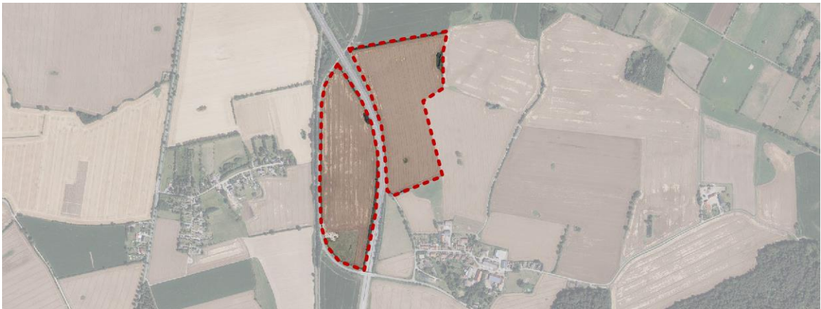
Abb.: Luftbild mit Geltungsbereich, Digitaler Atlas Nord

Das Plangebiet befindet sich in der Gemeinde Damlos und nordwestlich von Sebent. Das Vorhabengebiet besteht aus zwei Teilbereichen. Die Teilbereiche befinden sich beidseits der BAB A1 und östlich der Bahntrasse.