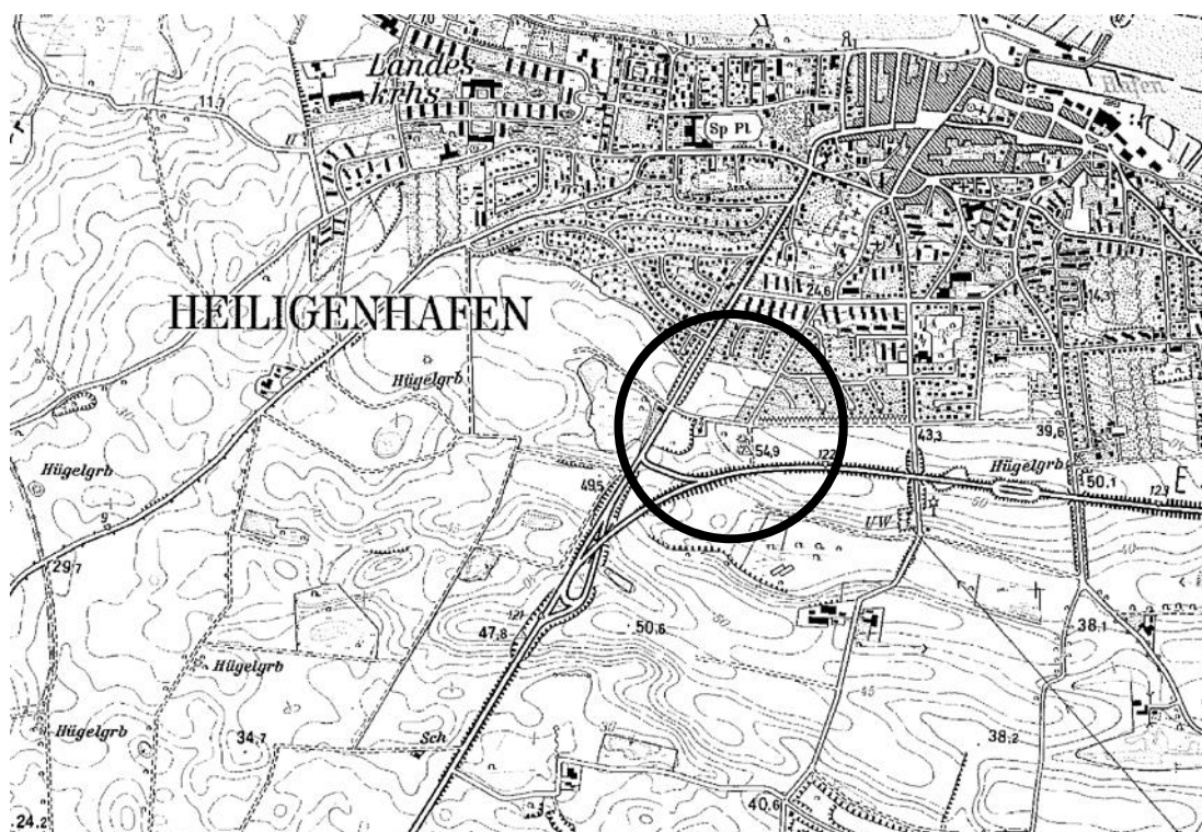
Lage des Plangebiets in der Stadt Heiligenhafen