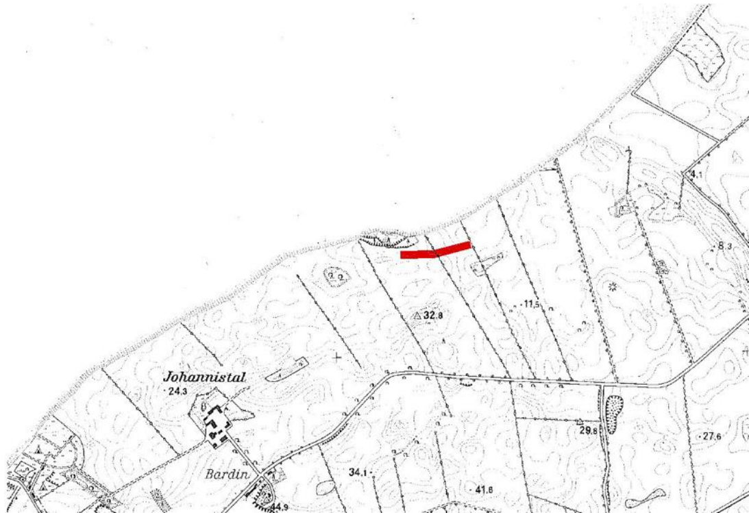
Lage des Knickausgleichs, Gemeinde Gremersdorf, Gemarkung Kembs, Flur 2, Flst. 6/4 und 10/5